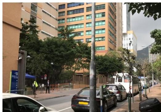
大學宿舍入口 保安檢查站

參加者請乘坐 25M 專線小巴 ，並必須預先向司機說明往浸大宿舍。由保安檢查點進入校園再到 S Gallery。